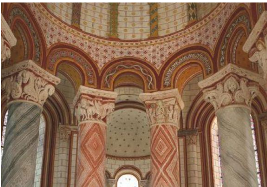
chapiteaux historiés du choeur de Saint Pierre

15 h : visite guidée de la collégiale Saint-Pierre au cœur de la cité médiévale, construite au 12e siècle, elle figure parmi les fleurons de l'art roman avec un très beau chevet et une décoration intérieure exceptionnelle, puis visite de l'église Notre Dame , dans la ville basse.