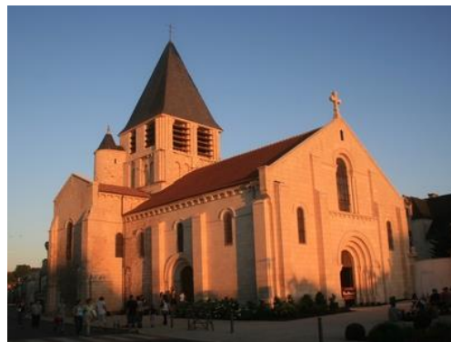
église Notre Dame

17 h 30 - 18 h : départ vers Poitiers et installation à l'hôtel Ibis Budget, 12 boulevard du Pont Achard, (l'hôtel est situé au centre- ville : tel 05 49 88 48 16)