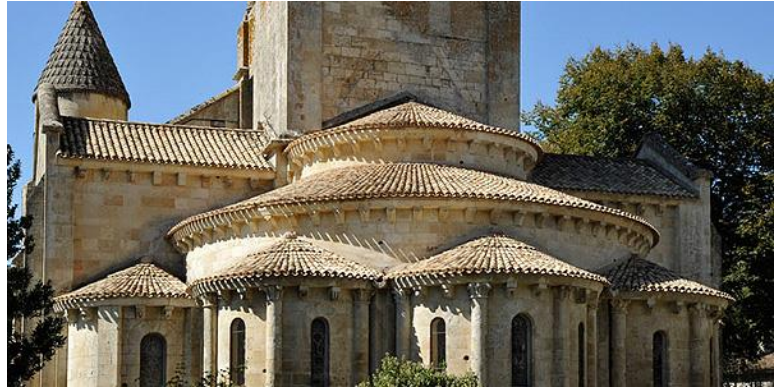
chevet de l'église Saint Hilaire de Melle