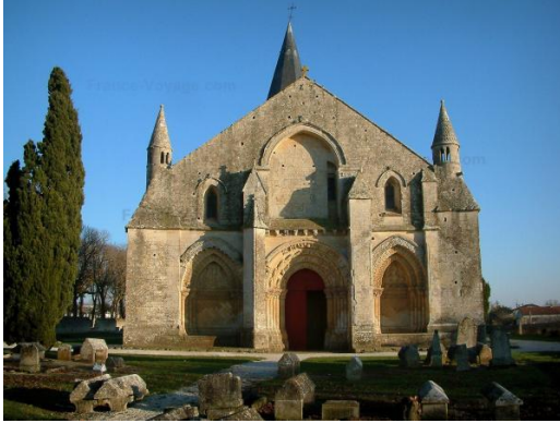
façade occidentale de Saint Pierre d'Aulnay

14 h 45 : visite guidée de l'église Saint Hilaire de Melle